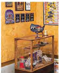
写真左：トロフィーやプラークなど、イベントで獲得したメモリアリアが收藏されているディスプレイラック。ガレージの一角はOSB合板を張り、バスター類などを飾りやすくしている。