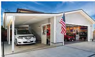
グリーンベル製「G23」をベースにカスタマイズを加えたガレージ。ドアは開け閉めの際に眠って車体にドアを充てないように引き戸になっている。