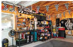
2×4パネル工法で建築されたガレージは、内装の一部を躯体現し仕上げとしている。ラック類は市販のものを流用。バナナやフラグをディスプレイするなど、アメリカンスタイルに仕上げている。